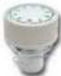
TENSION COMPLETE JH307#