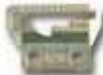
FEED DOG R28