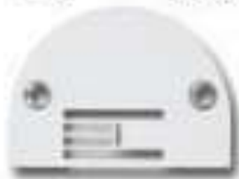
NEEDLE PLATE JA1-1